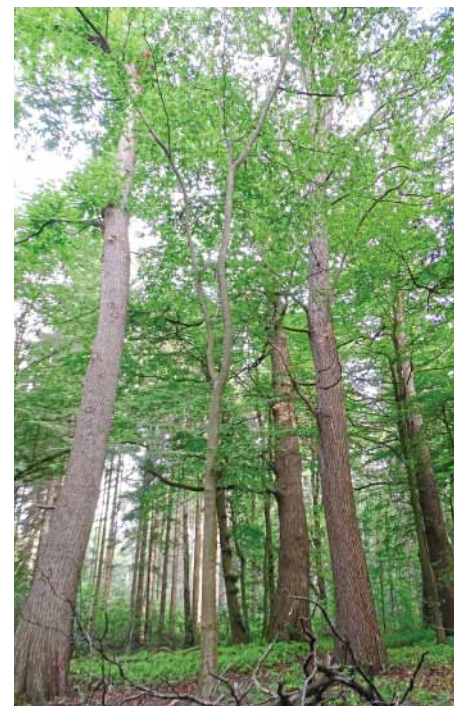
Abb. 3: 100-jähriger Edelkastanienbestand