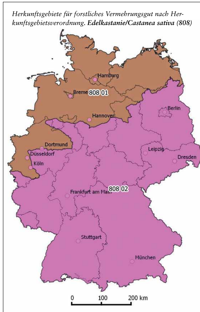
Abb. 4: Die forstlichen Herkunftsgebiete der Edelkastanie

Die Edelkastanie hat sich in den letzten 2.000 Jahren ganz gut bei uns – zumindest in den wärmeren Lagen Südwestdeutschlands – eingelebt und wächst auch im kühleren Deutschland zu respektablem Stärke heran. Gerade alte Edelkastanien gehören zusammen mit den Eichen zu den wertvollsten, biotopbildenden Baumarten unserer Wälder. Mehr als 1.000 Käferarten, darunter mehr als 300 xylobiontisch lebende Spezies, konnten auf Kastanien nachgewiesen werden. Dazu kommen Dutzende von oftmals seltenen Moosen, Flechten und Pilzen. Die hohe Lebenserwartung (bis zu 1.000 Jahre) und die lang andauernde Zerfallsphase ermöglichen