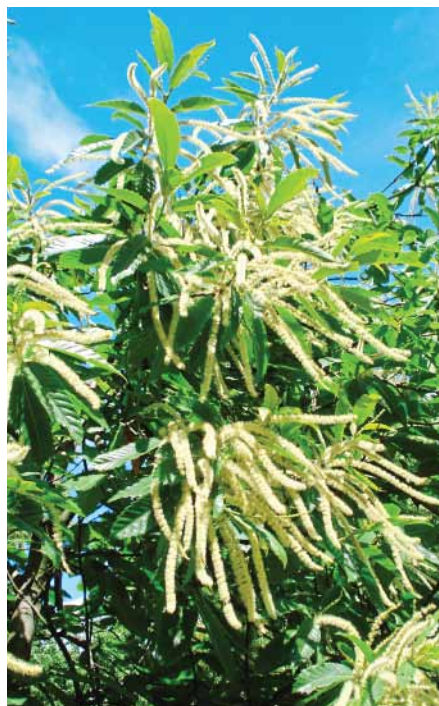
Abb. 2: Edelkastanienblüten