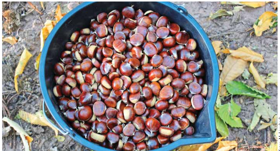
Abb. 1: Edelkastanienfrüchte (Maronen)