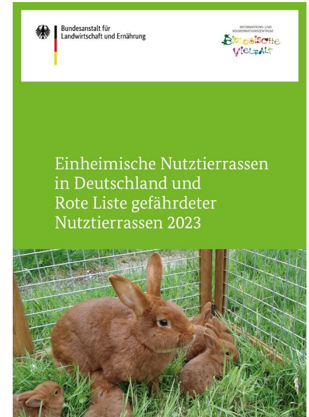
Rote Liste Broschüre 2023